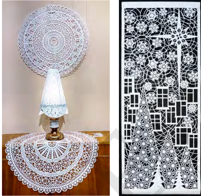
Сташкевич Н. Світильники з прорізними абажурами. Папір, вирізування. 2018 р.