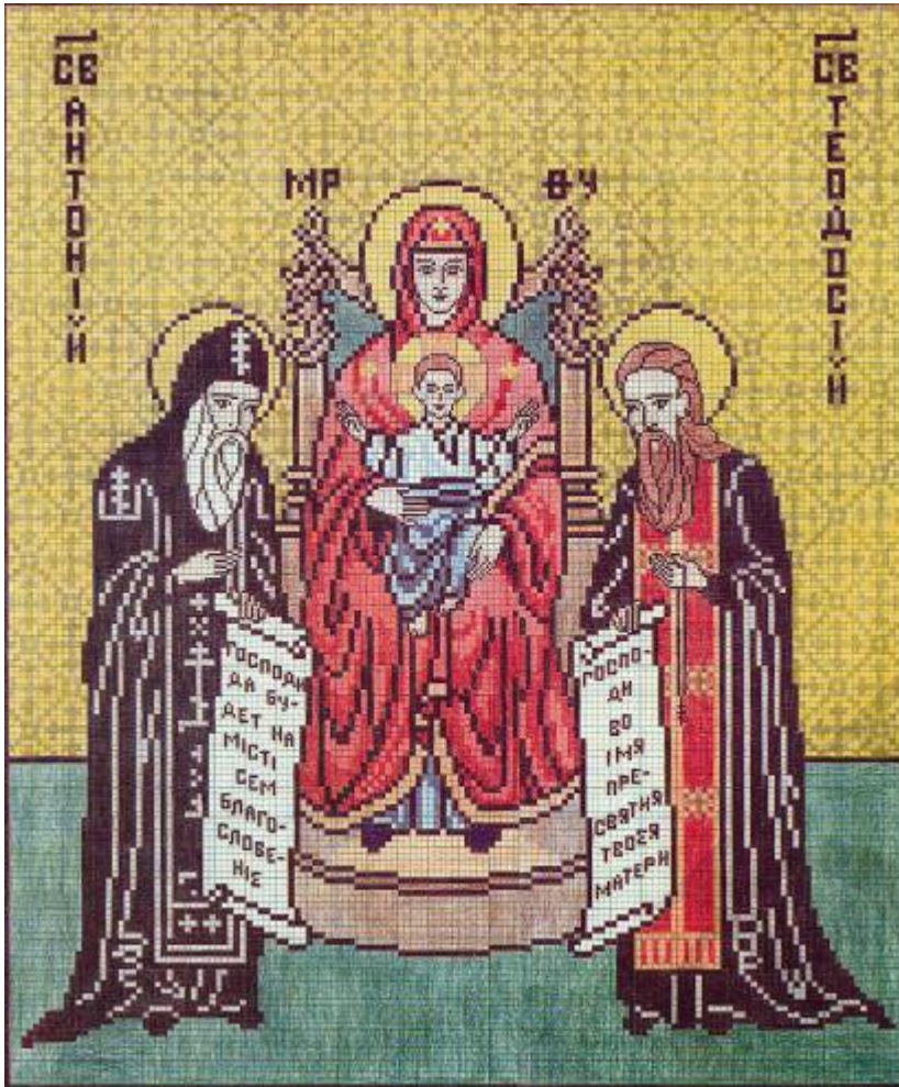
Богородиця і Св. Антоній та Теодосій Печерські Дмитро Блажейовський. Українські релігійні вишивки, 1996