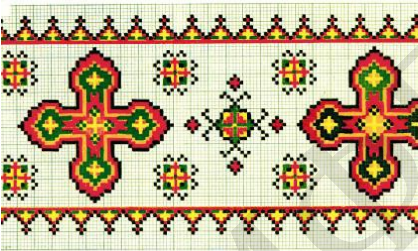
Дмитро Блажейовський. Українські вишивки, 1992