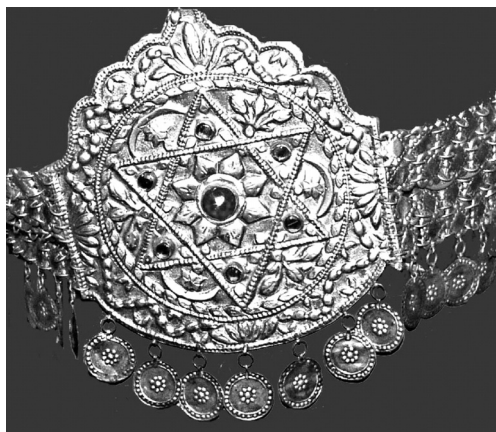
Фото 1. Налобна прикраса "Баш-алтин". XIX ст. БДІКЗ

Production of jewellery, a kind of traditional art of the Crimean Tartar people, that developed and improved during the centuries, is under research in this article. Basing on documentary, photographic, oral materials as well as on a few existing nowadays samples, the author explores various kinds of jewellery: headdresses, temple pendants, earrings, necklaces, bracelets, rings, and brooches. The article also informs of the jewellery production periods, their development, formation, and decline, as well as of the peculiarities of the goods by Tartar craftsmen, and the techniques they used. The author raises the problem of the revival of Tartar jewellery art.