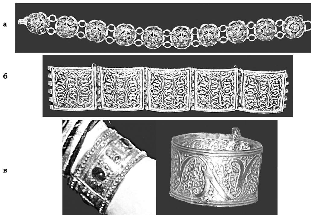
а б в Фото 4. Браслети “білезик”, БДІКЗ: а) складені браслети. Поч. XX ст.; б) складені браслети. XIX ст.; в) суцільні пластинчасті (гнучкі) браслети. XIX ст.