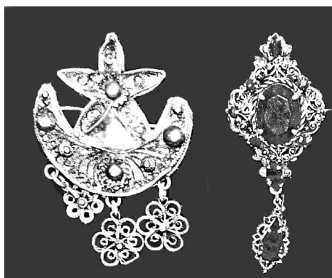
Фото 5. Брошки – “Зінет-інеси”. XIX ст. БДІКЗ