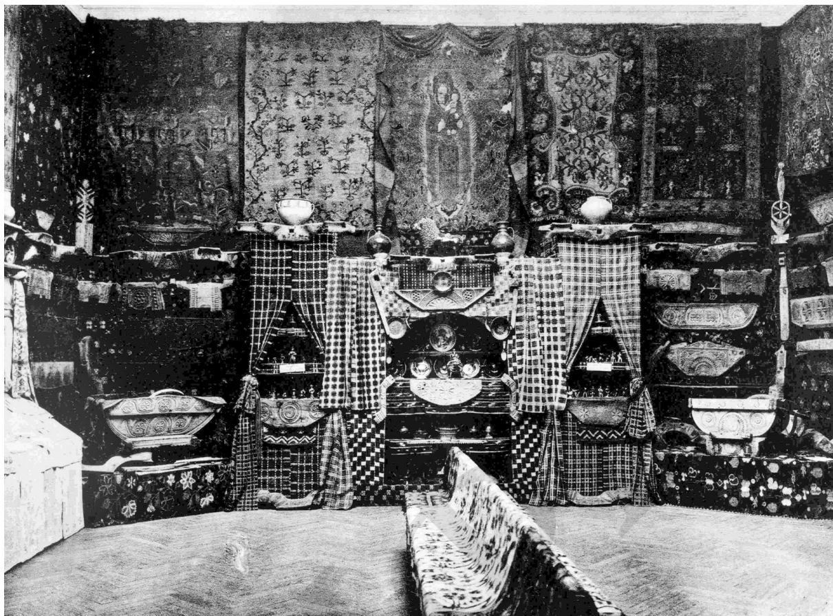
Експозиція Першої південноросійської кустарної виставки. 1906 р.