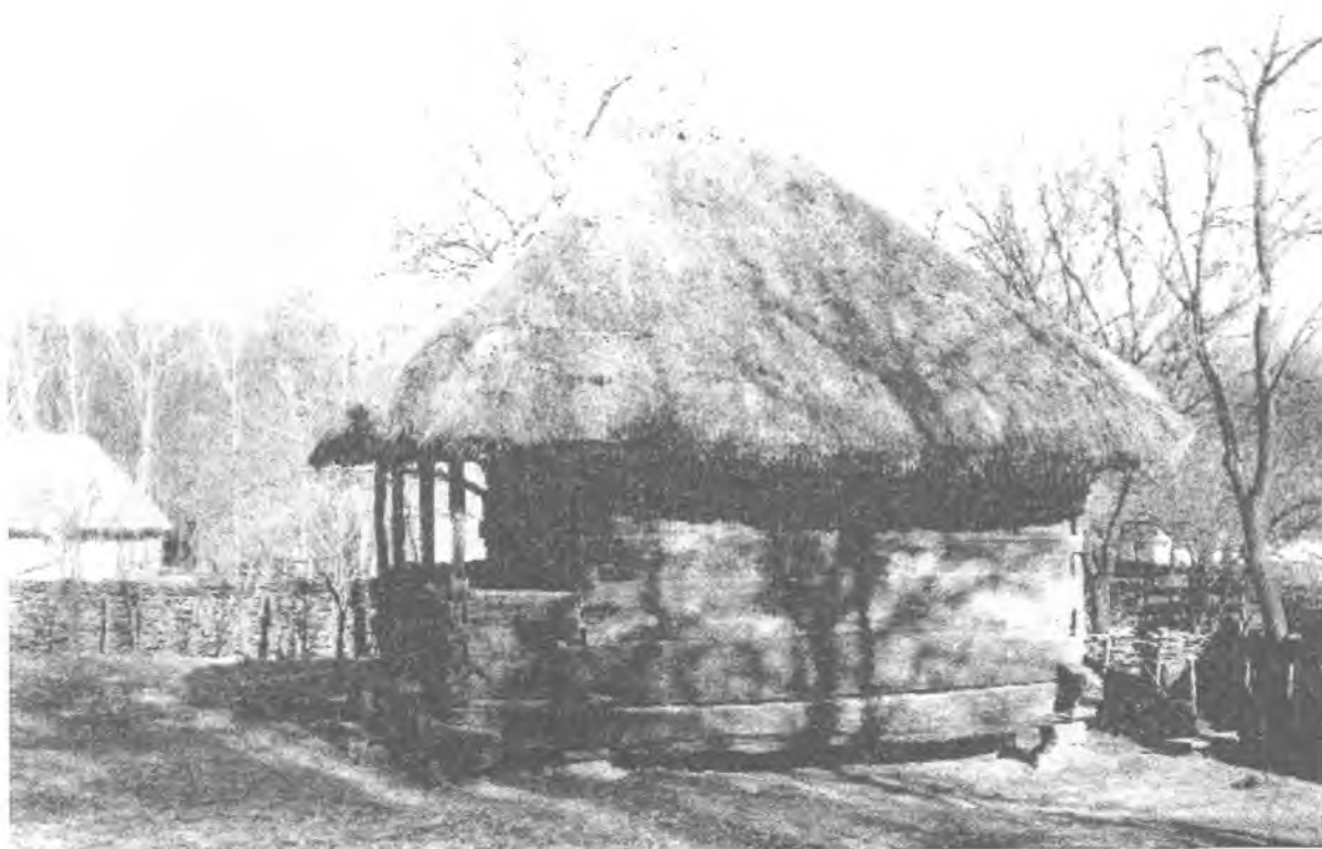
Фото 8. Комора с. Сухини Корсунь-Шевченківського р-ну Черкаської області. Музей народної архітектури та побуту України НАНУ