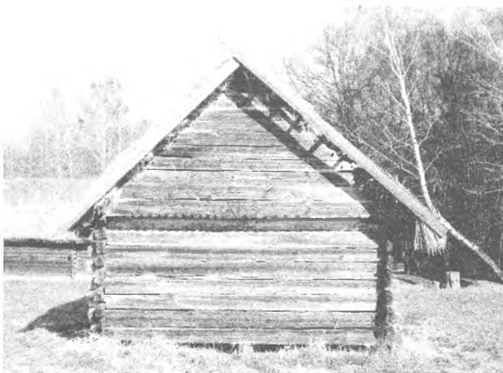
Фото 6. Шпихір с. Самари Ратнівського р-ну Волинської області. Музей народної архітектури та побуту України НАНУ