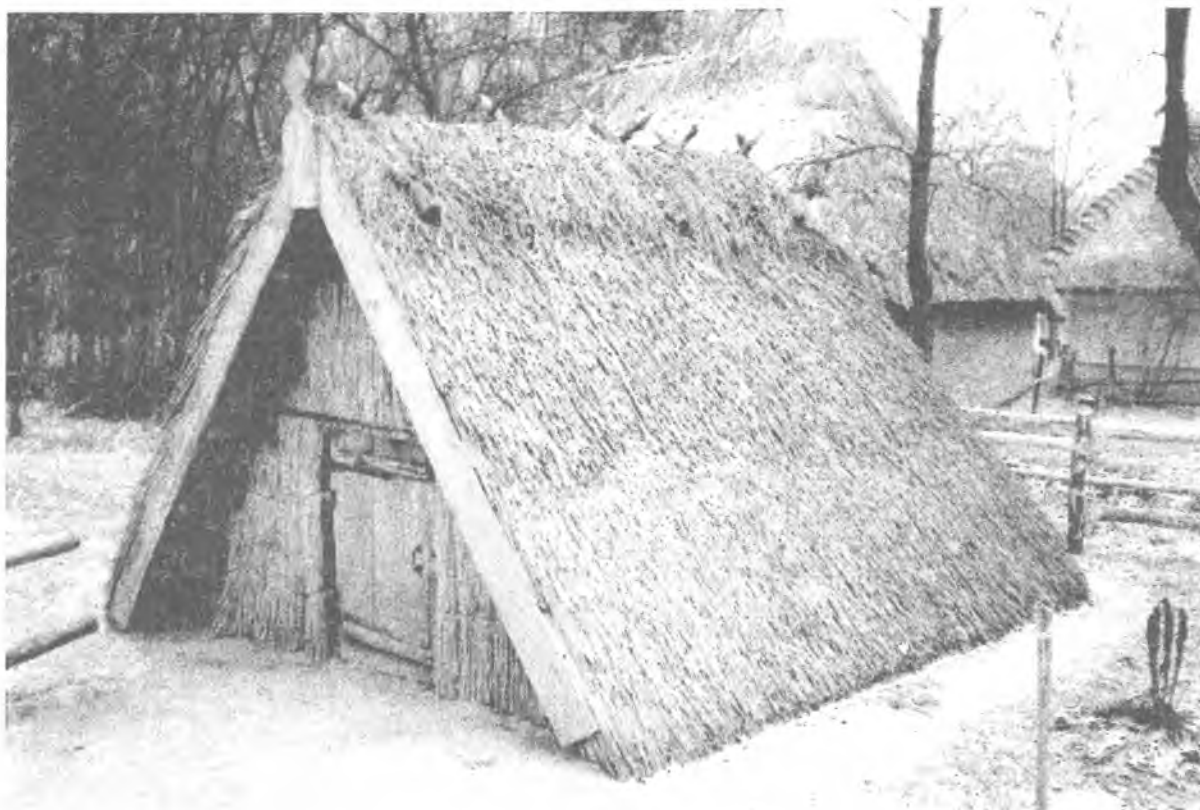
Фото 3. Катрага-омшаник с. Яснозір'я Черкаського р-ну Черкаської області. Музей народної архітектури та побуту України НАНУ