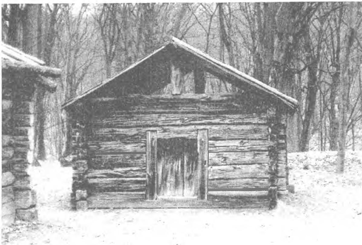
Фото 7. Стебка с. Познань Рокитнівського р-ну Рівненської області. Музей народної архітектури та побуту України НАНУ