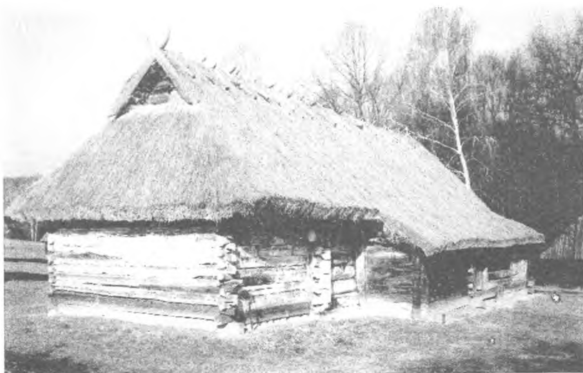
Фото 4. Хата с. Полиці Камінь-Каширського р-ну Волинської області. Музей народної архітектури та побуту України НАНУ