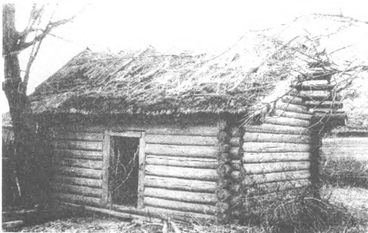
Фото 2. Кліть с. Машеве Семенівського р-ну Чернігівської області.