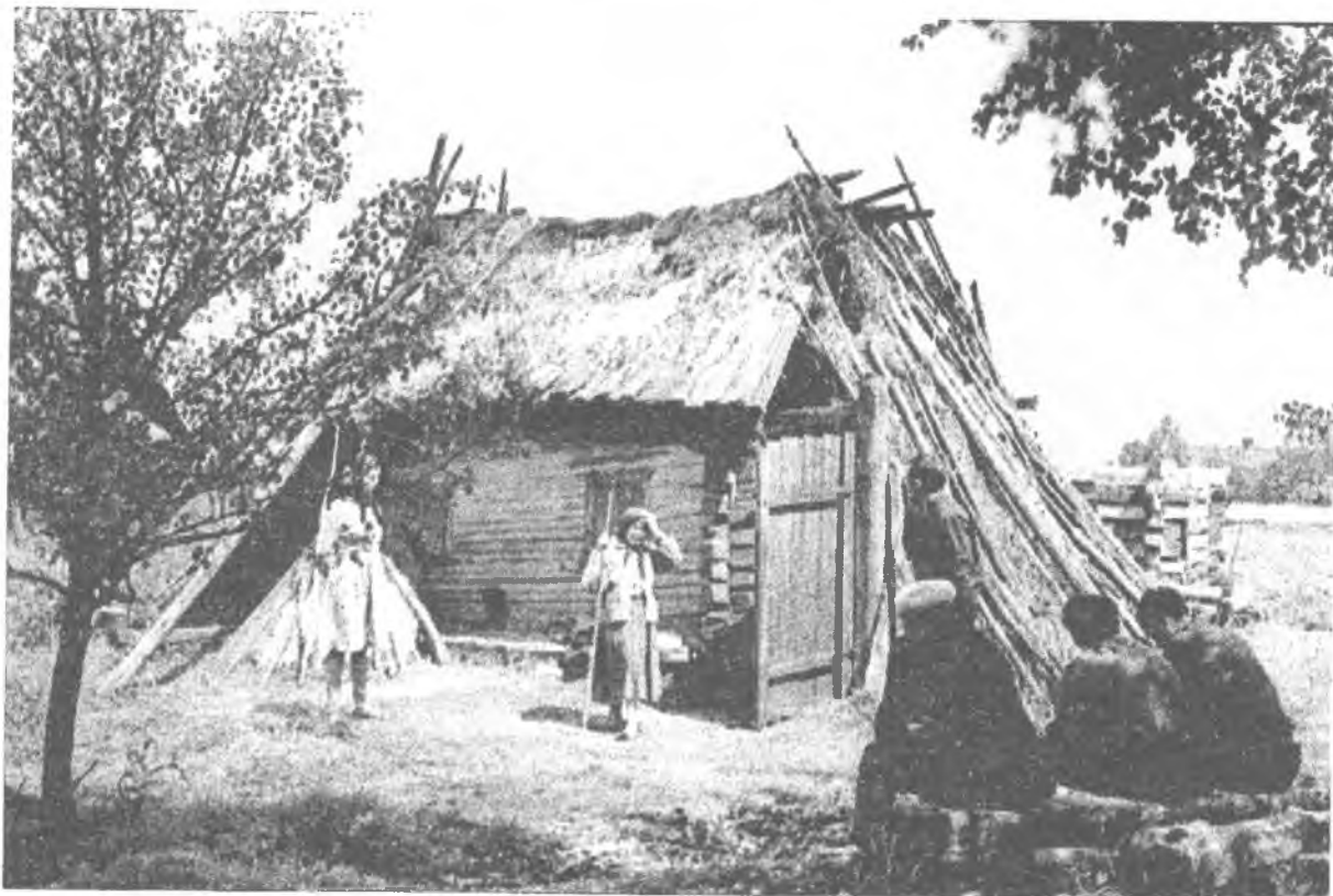
Фото 1. Хата с. Тур Ратнівського р-ну Волинської області.