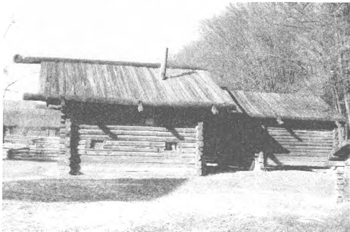
Фото 5. Хата с. Серники Зарічненського р-ну Рівненської області. Музей народної архітектури та побуту України НАНУ