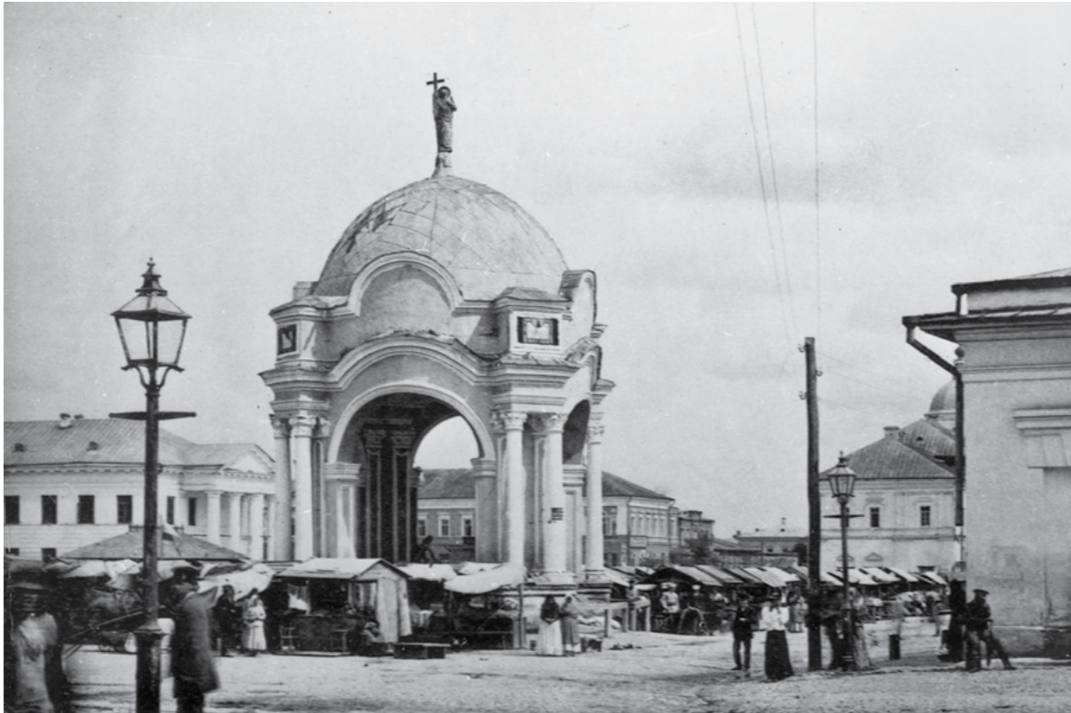
Контрактовий ярмарок у Києві. ХІХ ст.