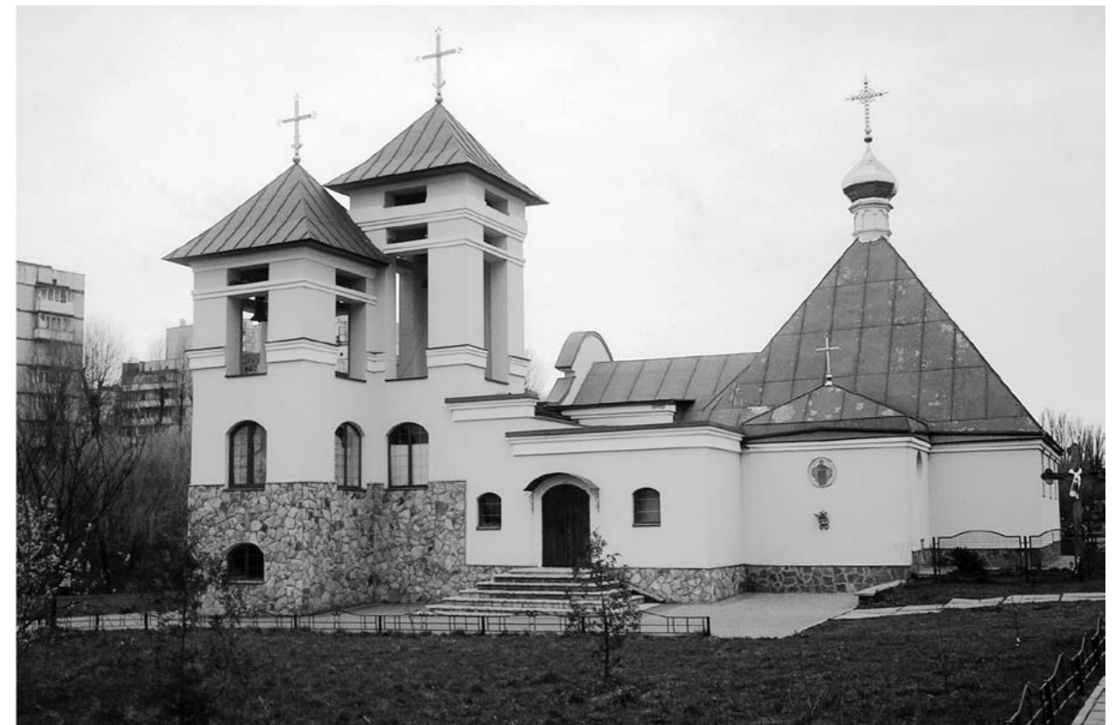
Церква Святих Бориса і Гліба (архіт. В. Жежерін). Київ, Теремки II. 2008

Нині вулиці забудовують три- і чотирьоповерховими будинками, в архітектурі яких використані стильові особливості українського