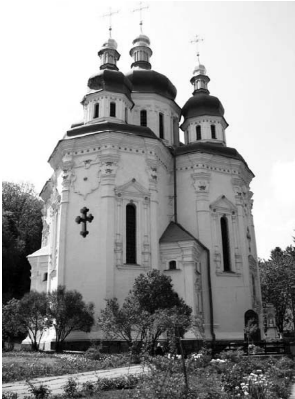
Георгіївська церква (фундатор М. Міклашевський). Київ, Видубицький монастир. 1696

бароко й модерну. Забудова району викликає суперечливі враження за своїм масштабом і перенасиченням декору. Найвдалішою є забудова на вулиці Кожум'яцькій, 10–22. У декорі будинків використані фігурні картуші, декоративні пілястри, напівколонки, багатопрофільне облямування вікон. Ріг вулиці підкреслений баштами (архит. В. Шкrogаль та ін.).