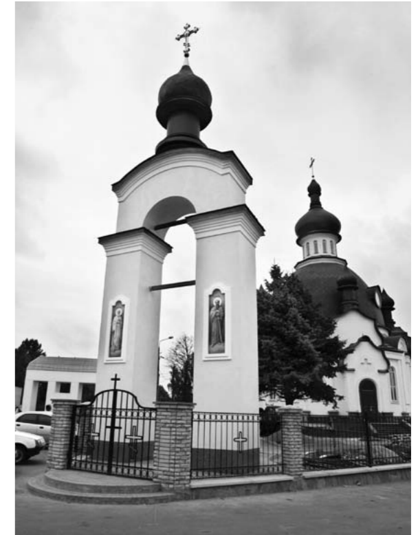
Храм апостолів Петра і Павла (архит. О. Слєпцов). Київ, Центральне кладовище на Берківцях. 2000–2008

Печерськ лежить між Липками, Кловом, Звіринцем і Дніпровськими схилами. Назва походить від печер Києво-Печерської лаври. У XII ст. утворилося Печерське поселен-