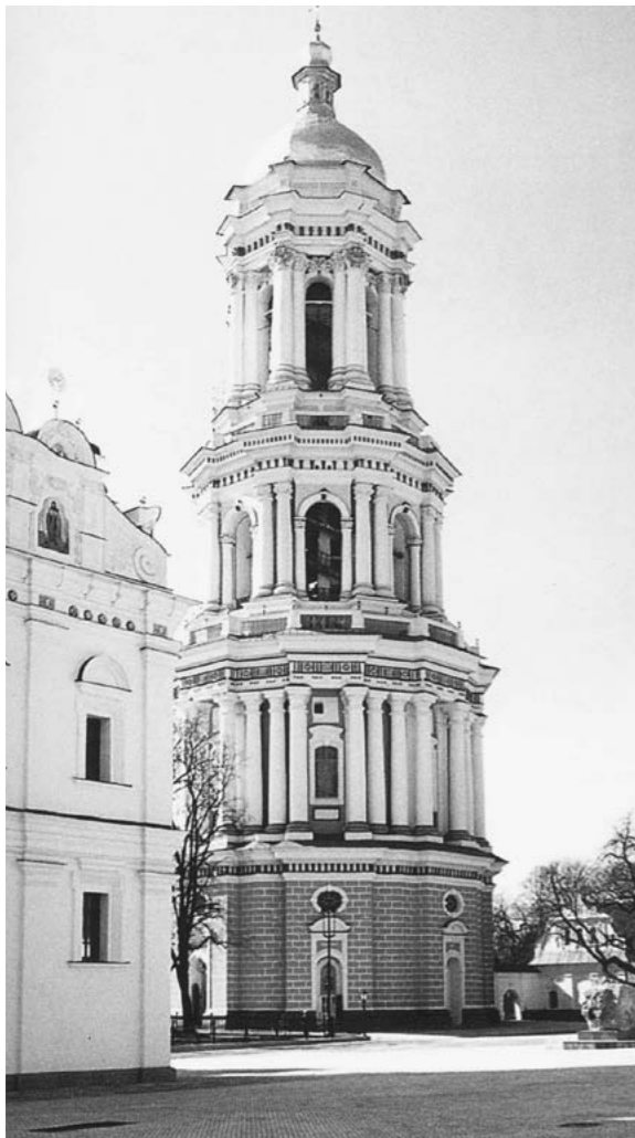
Дзвіниця Києво-Печерської лаври (архіт. Й. Шедель, 1735–1745)

Згідно з королівськими привілеями 1560, 1577 років та підтвердженням їх грамотами короля Сигизмунда III землі на р. Сирець, уздовж рік Ірпінь, Водиця, а також селищ Яснівка, Пріорка (Преварка), Мостище, Берківець — від Подолу до самого Вишгорода, у XVII ст. передали Домініканському монастиреві. У 1628 році в селищі Пріорка (Преварка) була заміська резиденція пріора Домініканського монастиря і слобода. Зауважимо, що основне населення цих земель — українці. З 50-х років XVII ст. селище перейшло у володіння Братського монастиря. У 1660-му році селище передали місту. З 1701 року воно підпорядковувалося Київському магістрату. У 1722 році тут спорудили дерев'яну церкву Георгія і Дмитрія.