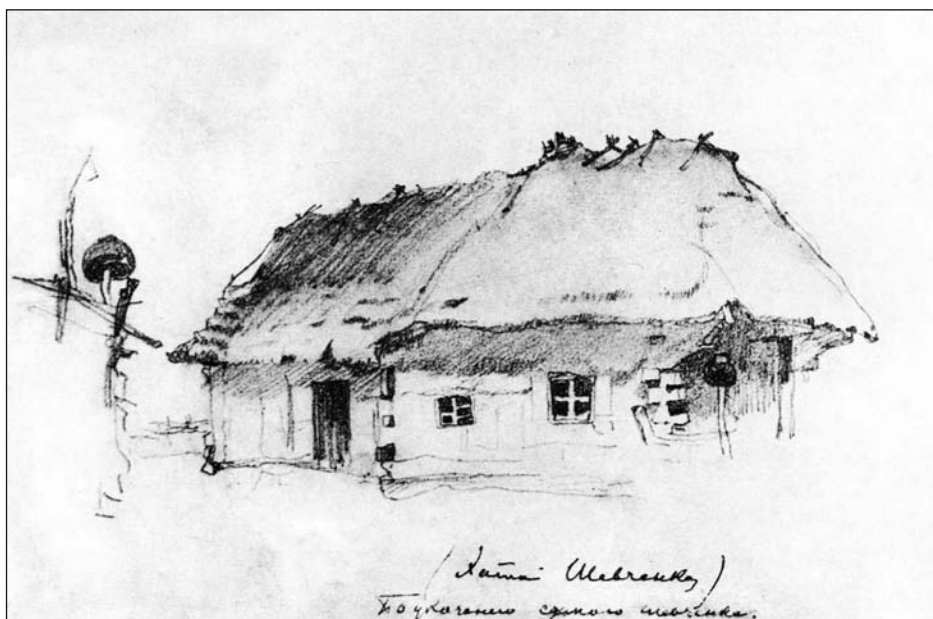
Іл. 1. Шевченко Т. Хата батьків у с. Кирилівці. 1843 р. Олівець

ставлення до батьківської оселі. Зовні хатиночка «у гаї» може здатися справжнім раєм завдяки чудовому докїллю, де «верби геть понад ставом тихесенько собі купають зелені віти» [21, с. 337]. У поета вона викликає сумні спогади про перші дитячі сльози, смерть батьків, важку працю, злиденне життя: