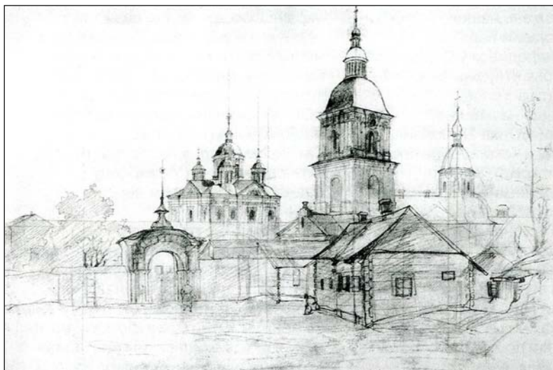
Іл. 6. Шевченко Т. Києво-Межигірський монастир. 1843 р. Олівець

та комплексів у Києві, Переяславі, Чигирині, Почаєві, Седневі, Межигір'ї, Полтаві та інших містах і селах. Серед них — Густинський монастир на Чернігівщині, заснований у XVII—XVIII ст. На час відвідин поетом (1845) він був у руїнах, пізніше — реконструйований і перебудований. Т. Шевченко виконав там три акварелі [12, с. 179], як він сам згадує: «...главные или святые ворота, да церковь о пяти главах, Петра и Павла, да еще трапезу и церковь, где погребен вечные памяти достойный князь Николай Григорьевич Репнин, да еще уцелевший циклопический братский очаг» [18, с. 428]. Про Густинський монастир, що його в той час лише почали відновлювати, Т. Шевченко побіжно згадує в повісті «Наймичка» [15, с. 74] та розлогіше й емоційніше в повісті «Музикант».