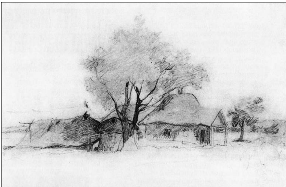
Іл. 2. Шевченко Т. Селянське подвір'я. 1845 р. Начерк

яку документальну цінність. Адже в жанрових роботах, заради композиційних вимог, художники часто інтерпретують натуру довільно, якщо не стоїть спеціальне завдання точної фіксації об'єктів. Подібний випадок маємо, зокрема, у композиції «Старости» (офорт, 1844 р.) та її варіанті з такою самою назвою (сепія, 1844 р.). В обох сюжетах показано в інтер'єрі української хати обряд сватання. Привертають увагу традиційні елементи хатнього простору: дощана стеля, що спирається на сволок; лава з грубезної дошки, на якій не тільки сиділи, але й спали члени великих родин; полиця з кронштейном; квадратне вікно із широкими лутками — такі вікна траплялися на Черкащині ще донедавна (подібні приклади можна побачити в зоні «Середня Наддніпрянина» Національного музею народної архітектури та побуту України). Проте в розміщенні деяких елементів та в кількості вікон простежуємо відхилення від традиції.