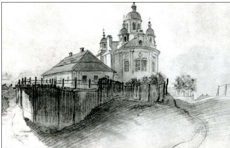
Іл. 5. Шевченко Т. Будинок І. В. Котляревського у Полтаві. 1845 р. Акварель

позицій (іл. 4). На одному з малюнків у лівій частині сюжету на пагорбі розташоване селянське подвір'я, значно вище рівня заглибленої в рельєф дороги. Причілком до вулиці звернена широка, рублена, обмазана й побілена хата типу «хата — сіни — комора», з дощаною покрівлею, оперезана призьбою. Чотири вікна — по два на причілку й чолі — освітлюють приміщення. За хатою проглядається хлів чи повітка під солом'яною покрівлею. На другому малюнку садиба також розміщується на пагорбі, але праворуч дороги, до якої вона повернена затилям. Біля хати — господарська будівля. Перспектива вулиці завершується церквою із широкою банею та декоративною маківкою. Наявність церкви свідчить про значну чисельність населення в с. Решетилівка, а характер сільської забудови — про заможність господарів.