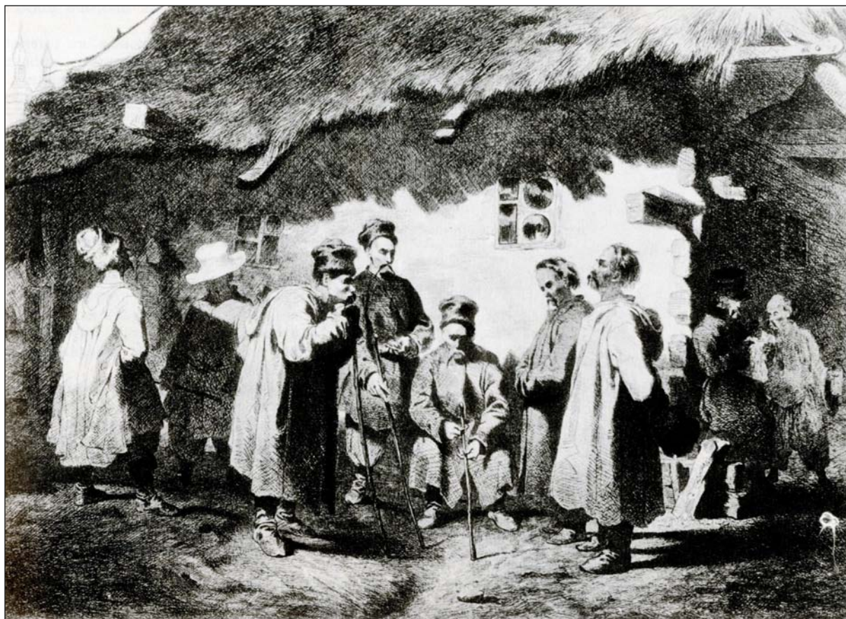
Іл. 3. Шевченко Т. Судня рада. 1844 р. Офорт

Серед багатьох зображень сільського житла в Шевченковій образотворчій спадщині деякі мають особливо гостру соціальну спрямованість. Скажімо, на малюнку «Вдовина хата на Україні» показано недобудовану споруду. Притулений до поперечної стіни хати бовдур, який розташовується в сінях, за їх відсутності проглядається зовні. У нижній частині бовдура влаштовано отвір, через який