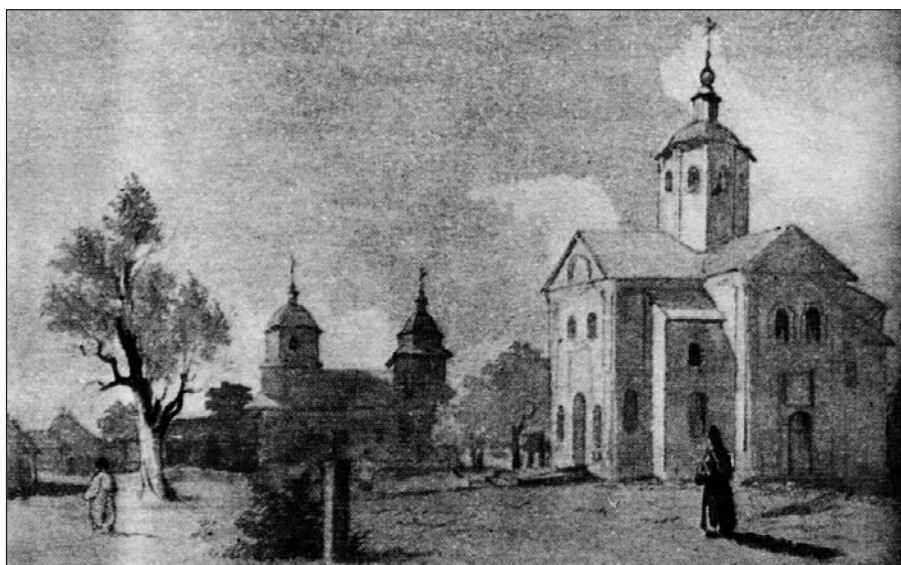
Іл. 7. Шевченко Т. Мотронинський монастир біля Чигирин. 1845. Акварель

Свою увагу Т. Шевченко звертав не лише на монументальні храми, але й на звичайні скромні дерев'яні церкви, дзвіниці, каплиці. Наведемо кілька прикладів. «Вот мы и приехали в село Иваньцю... Он [мужик. — З. Г.] повел нас мимо старой деревянной одноглавой церкви и четырехугольной бревенчатой колокольни». Можливо, остання була подібна до