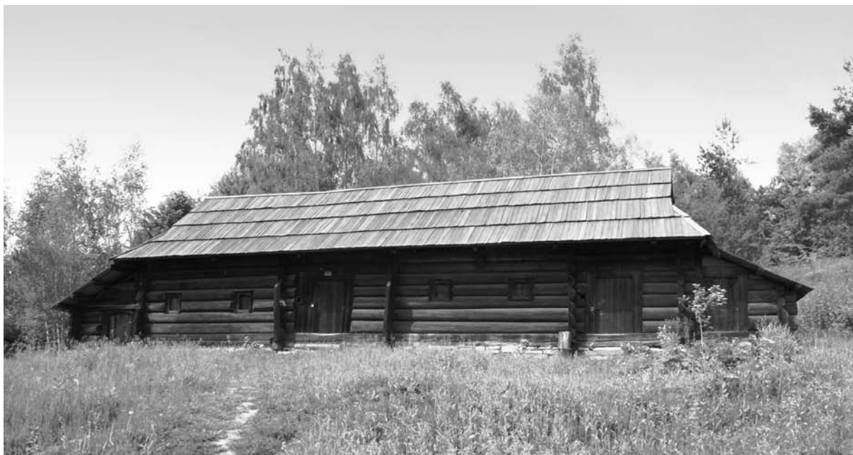
Хата із с. Бережниця Верховинського р-ну Івано-Франківської обл. XVIII – середина XIX ст. Національний музей народної архітектури та побуту України.

“заміточками”. А ди?! Круглу форму печі укладали камінням. На припічках грілися діти, на піч старенькі було підуть деколи погрітися» [10].